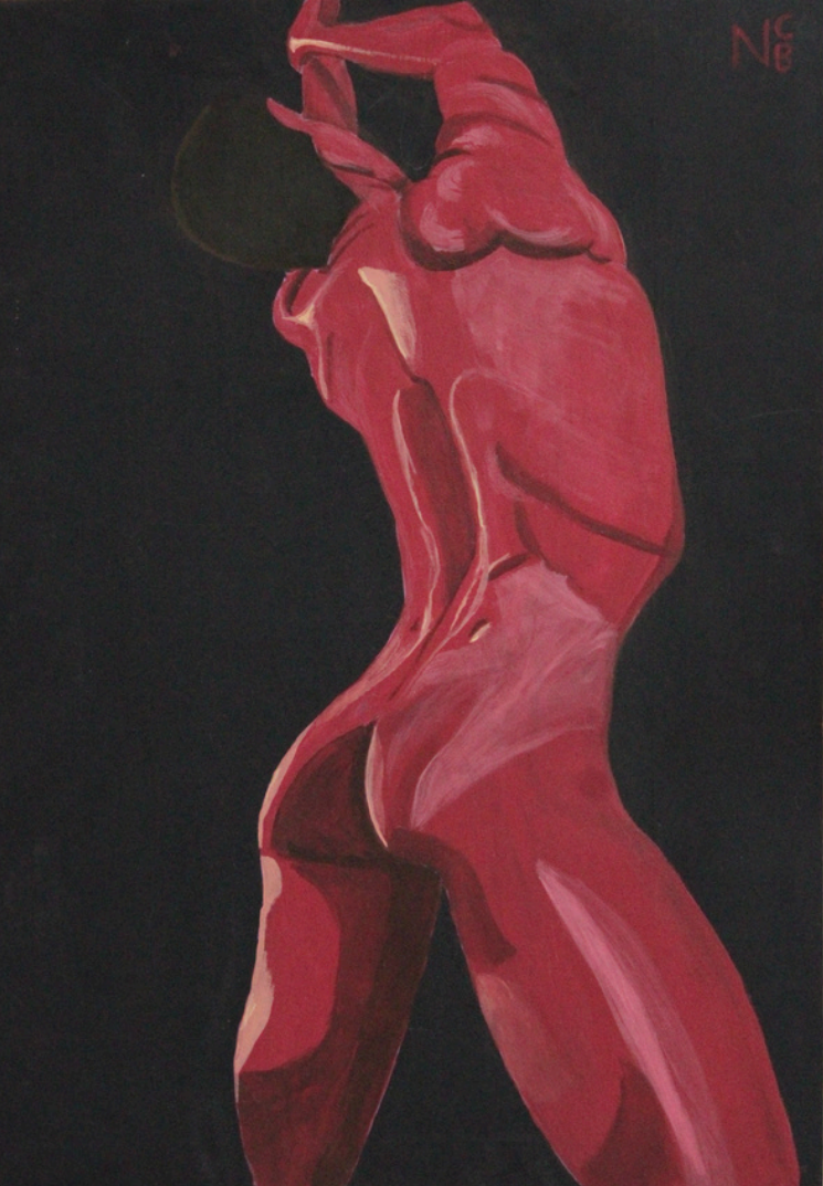
TÍTULO: Rojo como el mundo (2024). Acrílico sobre tabla (35 x 50 cm).