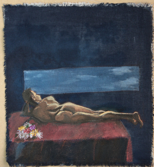
TÍTULO: Desnudo y ventana (2024).

Acrílico sobre lienzo tratado con químicos de cianotipia y enjuagado (20 x 20 cm).