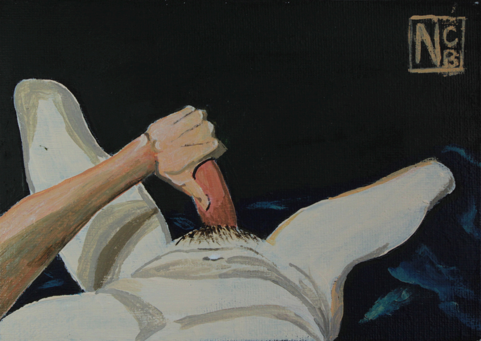
TÍTULO: El sable de Bolívar (2023). Acrílico sobre lienzo (12.7 x 17.8 cm).