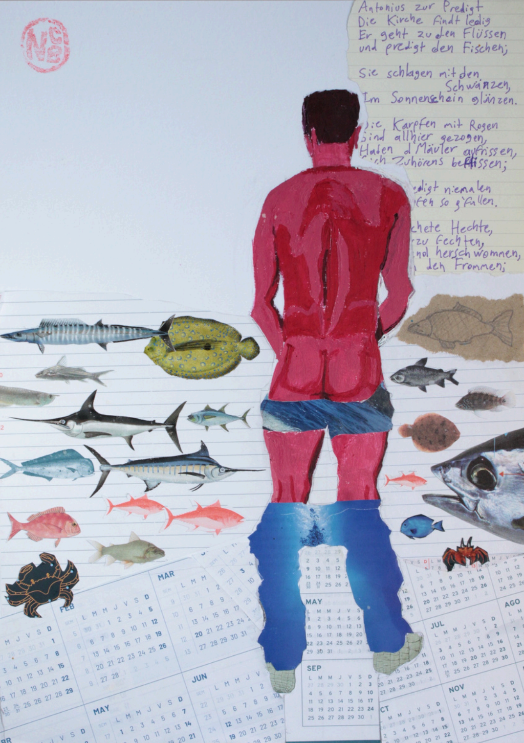
TÍTULO: El sermón de San Antonio de Padua a los peces. (2'24). Acrílico y collage (35 x 25 cm).

Esta es una interpretación erótica y blasfema del texto de un poema tradicional alemán recogido en: "El niño del cuerno mágico", musicalizado por Gustav Mahler. En el poema se cuenta que san Antonio, al ver la iglesia vacía, fue a predicarle a los peces, que parecían estar absortos con sus palabras, aunque al final, todos olvidan el sermón. «El sermón ha gustado y todos siguen siendo los mismos de siempre.»