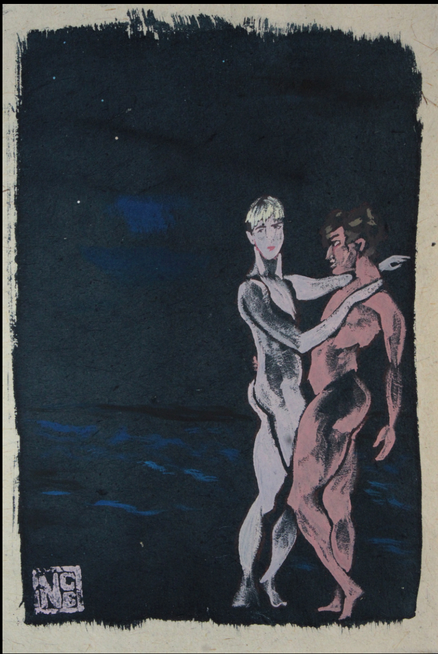
TÍTULO: Rosa sobre azul (2024).

Acrílico sobre lienzo tratado con químicos de cianotipia y enjuagado (20 x 20 cm).