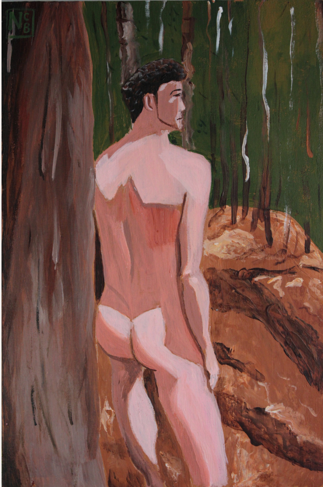
TTÍTULO: David en el monte (2023). Acrílico sobre madera (30 x 20 cm).