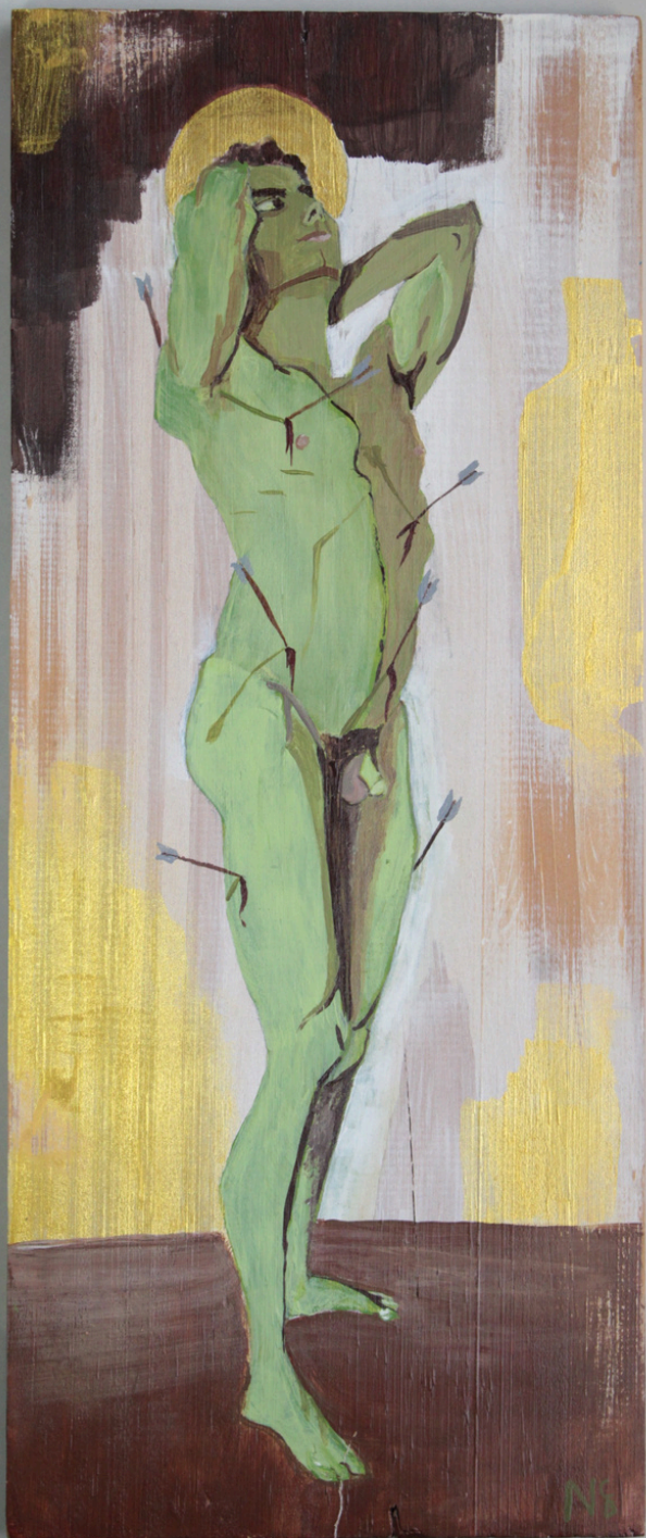
TÍTULO: San Sebastián (2022). Acrílico sobre madera (14 x 33.5 cm)