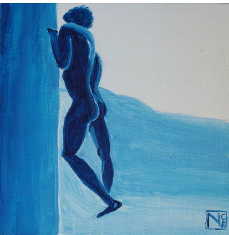
TÍTULO: Azulejo (2023). Acrílico sobre tabla (20x20).