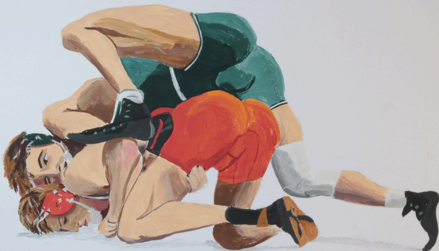
TTÍTULO: Génesis 32:24 o El poema del sudor (2024). Acrílico sobre cartulina (25 x 17 cm).